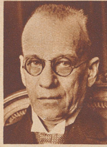
† Nationalrat Dr. E. Mäder ursprünglich Tierarzt, seit 1920 Mitglied des Regierungsrates von St. Gallen, wo er das Finanzdepartement verwaltete, seit 1923 Vertreter der St. Galler Konservativen im Nationalrat, starb 61 Jahre alt.