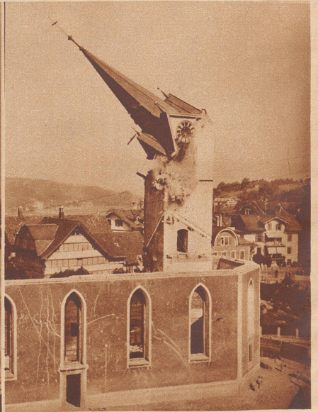
Nachdem die katholische Kirche von Herisau 57 Jahre alt geworden ist, wird sie jetzt niedergelegt, um durch eine größere ersetzt zu werden. Vergangenen 20. Juni nun war für den Turm das letzte Stündchen gekommen. Er wurde gesprengt, und zwar etappenweise, weil der in unmittelbarer Nähe liegende Tunnel der Appenzellerbahn und die nächsten Häuser eine größere Sprengung nicht ratsam erscheinen ließen. Bilder von links nach rechts: Um das Wegschleudern der Steine zu verhindern, wurde der Turm an der Stelle, wo die Sprengladung eingelegt war, mit Tannästen verkleidet. Die erste Ladung war nicht stark genug, um den ganzen Turm zum Einsturz zu bringen, der Helm blieb noch stehen und wurde später mit einem Drahtseil zu Fall gebracht. Aufnahmen Bauw