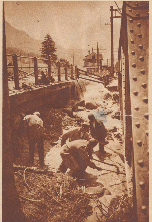
Unwetter über dem Frutigtal. Ein heftiges Unwetter mit wolkenbruchartigem Regen und Hagelschlag ist am 17. Juni über das Latreien- und Suldtal im Berner Oberland niedergegangen. Bild: Ganz besonders schwer wurde das Trasse der Lötschbergbahn bei der Station Mülènen in Mitleidenschaft gezogen. Arbeiter beim Wegräumen des angeschwemmten Gerölls unter einer Eisenbahnbrücke.