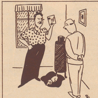
«Bring sofort den Brief da zur Post.» «Aber bei diesem miserablen Wetter jagt man doch keinen Hund auf die Straße!» «Wer sagt denn, daß du den Hund mitnehmen sollst?!» (Das illustrierte Blatt)

«Einen Mann kann man erst dann erfolgreich nennen, wenn er mehr verdient, als seine Frau ausgeben kann.» «Und eine Frau kann man erst dann erfolgreich nennen, wenn es ihr gelungen ist, einen solchen Mann zu heiraten.»