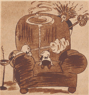
«Was meinst du, Willi, ob das Rauchen körperlichen Schaden zur Folge haben kann?» (Die Koralle)

Man hat Tobias einen Streich gespielt. Jemand hatte seine Todesanzeige in der Zeitung veröffentlicht. Wütend telephoniert Tobias an einen Freund: «Hast du die Anzeige gelesen? Hast du sie gesehen?» «Ja...», zittert die Stimme auf der anderen Seite, «aber von wo aus sprichst du denn?»