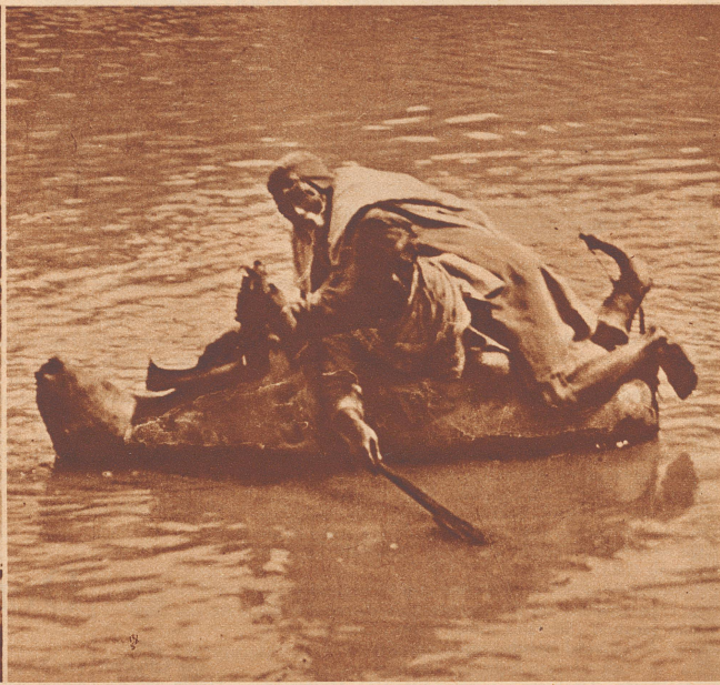
Diese Tierhäute benützen die Inder als luftige Boote zum Ueberqueren von Flüssen. Hier sieht man gleich zwei Männer auf einer Ochsenhaut liegen.