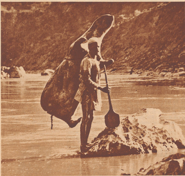
In Kaschmir, in den indischen Bergen, sieht man häufig Eingeborene, mit luftgefüllten Tierhäuten auf dem Rücken, über Berg und Tal wandern.