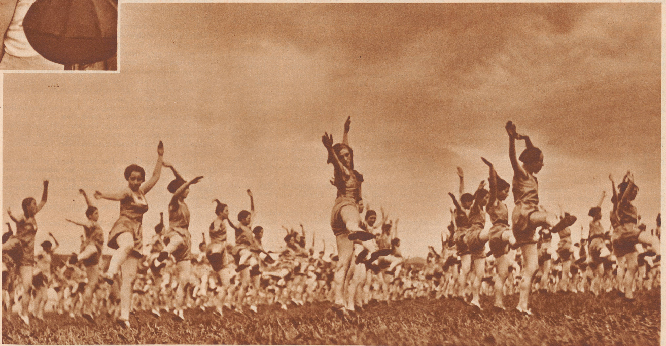
Zum erstenmal wurden die allgemeinen Übungen im Walzerrhythmus (¾ Takte) durchgeführt. Der Versuch bewährte sich: das rhythmisch beschwingte, leicht tänzerische entspricht dem natürlichen Bewegungsverlangen des menschlichen Körpers besser als die frühere mehr starre Turnweise.