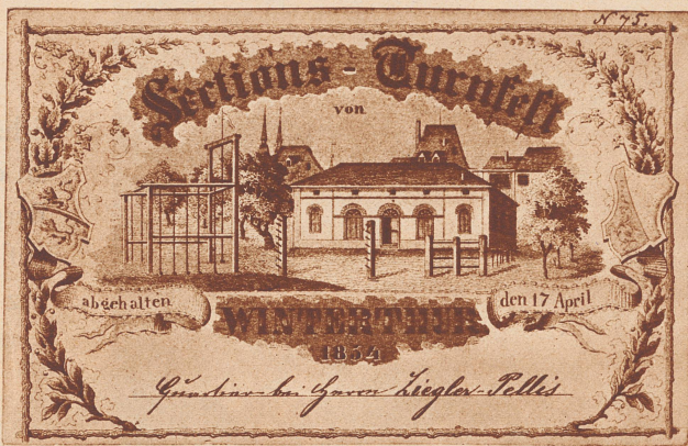
Quartierkarte für ein Sektions-Turnfest, die das einzige noch erhaltene Bild der ersten Turnhalle in Winterthur zeigt.

Aus der Geschichte der Stadt Winterthur, nach Urkunden bearbeitet von Job. Conrad Troll, Präsident des Schulrathes und d. Z. Rector. Mitglied der allgemeinen geschichtsforschenden Gesellschaft für die Schweiz, 1848.