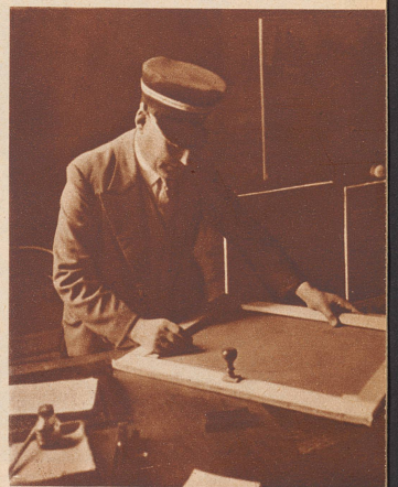
Bevor ein Bild das Museum verläßt wird es vom Chefaufseher gestempelt.