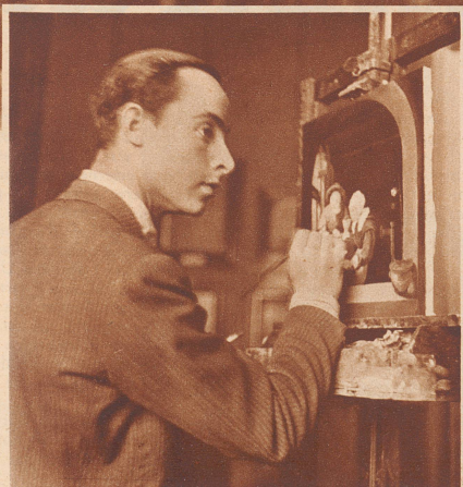
«Neben meinem Malstudium hier in Florenz versuche ich mit Kopieren etwas zu verdienen», erklärt dieser 21jährige Italiener. Er arbeitet mit Eifer an einem kleinen Bild mit starken Farbkontrasten.