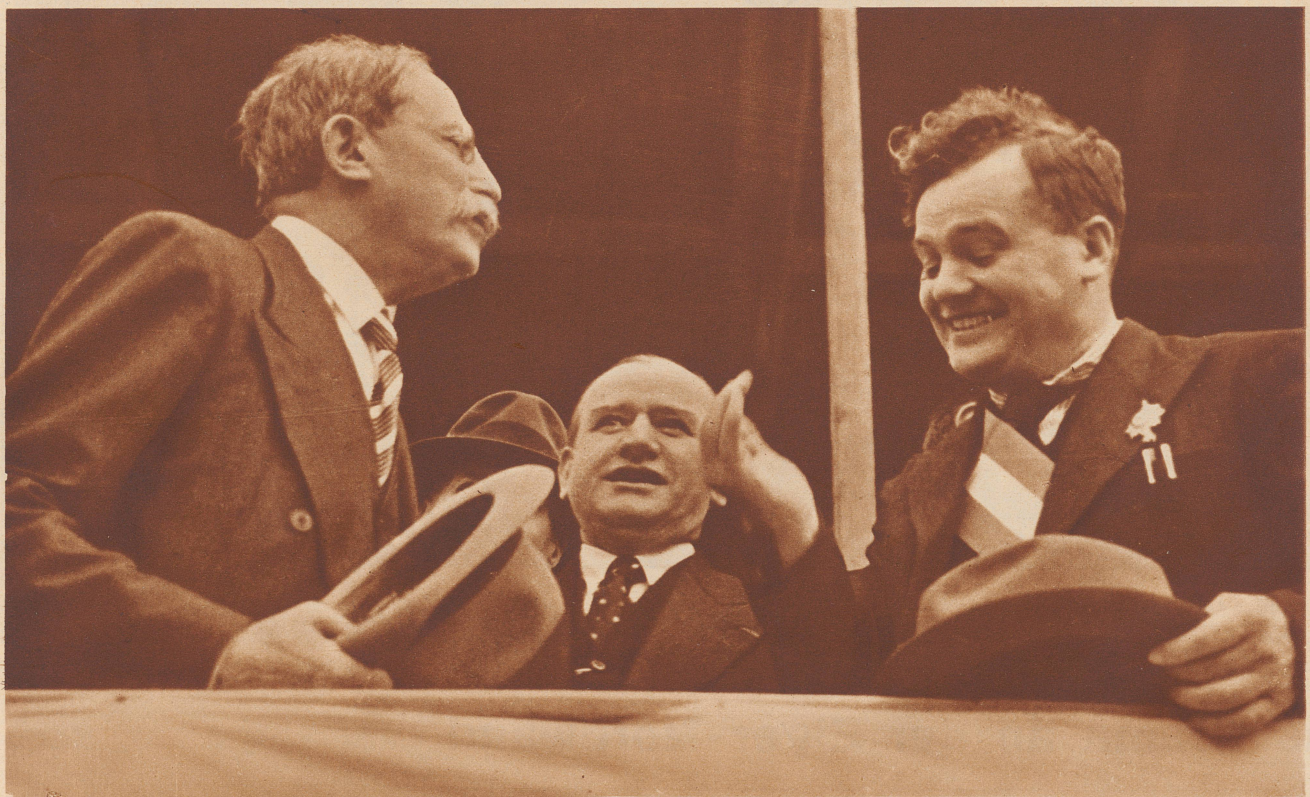
Die Vertreter der drei führenden Parteien der Volksfront auf der Tribüne während der Totenfeier in Verdun. Von links nach rechts: Léon Blum (Sozialistische Partei), Daladier (Radikal-Sozialisten), Maurice Thorez, Maire von Saint Denis (Kommunisten).

Ueber eine halbe Million Männer sind in den Kämpfen um Verdun im Weltkrieg gefallen. Jetzt, zwanzig Jahre nach diesen grauenvollen Kämpfen, die sich über ein halbes Jahr sozusagen ohne Unterbrechung aneinanderreiheten, jetzt also trafen zwanzigtausend Männer dort zu einer stillen Totenehrung ein, Franzosen, Deutsche, Belgier, Engländer, Abordnungen aus der Tschechoslowakei, Rußland, fast alles ehemalige Frontkämpfer. Eine Fackel, am Samstagabend an der Flamme am Grabe des unbekanntes Soldaten in Paris entzündet, kam am Sonntagabend, den 12. Juli, auf dem Soldatenfriedhof in Verdun an. Am Abend versammelten sich im Staatsfriedhof von Douaumont 20 000 Frontkämpfer. Hinter jedes Kreuz (siehe Bild) der 15 000 Kriegergräber stellte sich ein ehemaliger Soldat. Manche von ihnen waren mit ihren Söhnen gekommen. Die Führer der Delegationen leisteten am Mikrophon, jeder in seiner Muttersprache, den Schwur, der als Titelzeile über diesen Bildern steht.