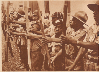
Pflückerverbände bestehen in den meisten Küstenstädten Westafrikas. Bombussungen dienen als Substitut.