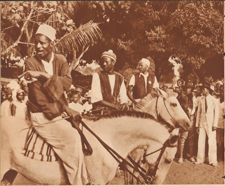
Pferdemänner in Monrovia. Drei «Vollblüter» stehen bereit zum Start. Bevor sie losgehen, zerwickelt sich ein endloses Pulver zwischen Starter und Reiter.