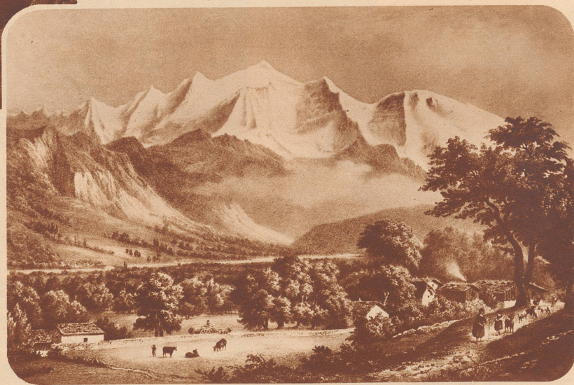
Le Mont Blanc depuis Sallenche.

Nach einer Lithographie von A. Cuvillier.