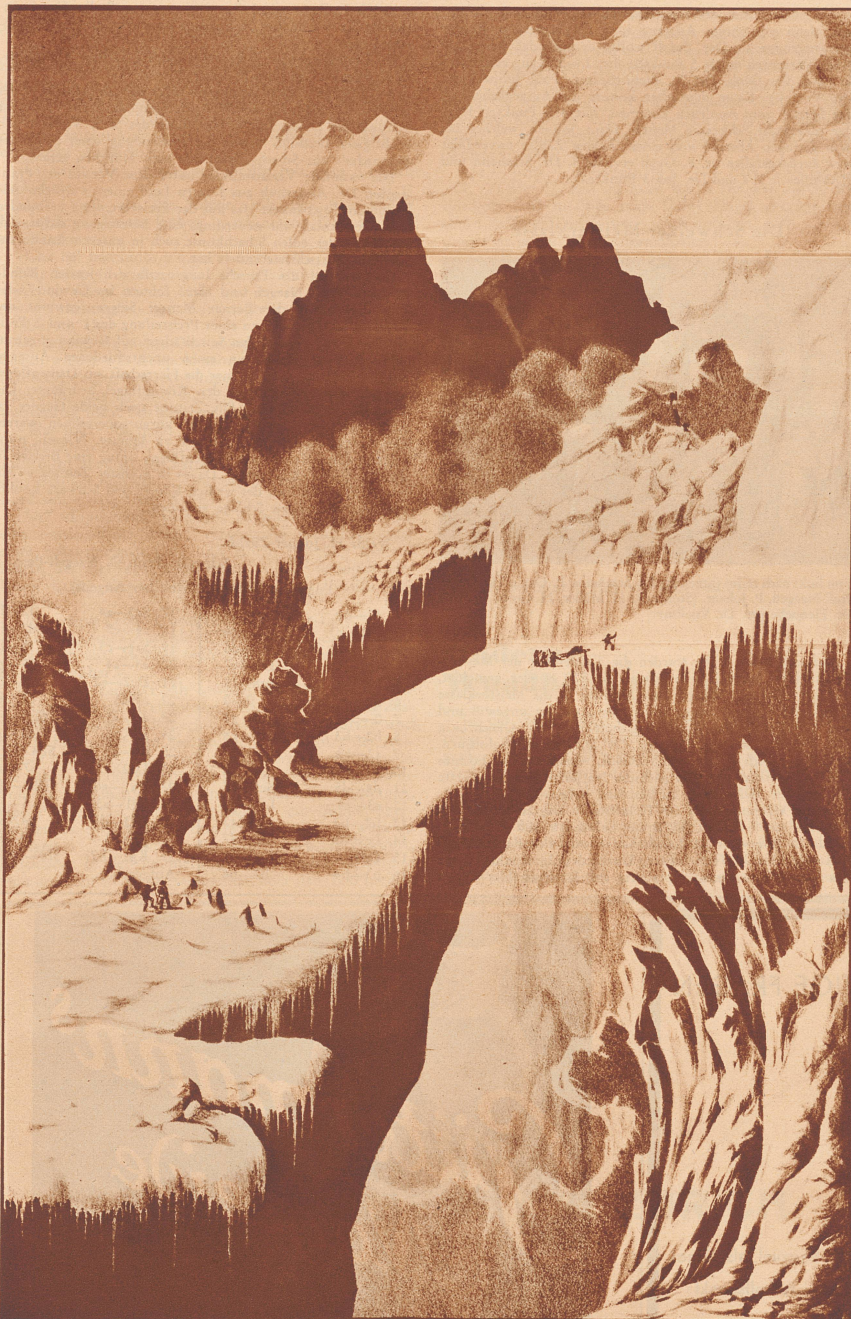
«Meine Ueberschreitung der Gletscher von Buissons und Tacconay in der Nähe der Grands Mulets-Felsen.» Aus Dr. W. Pitschner, Der Montblanc, Darstellung und Erstbesteigung desselben am 31. Juli, 1. und 2. August 1859.