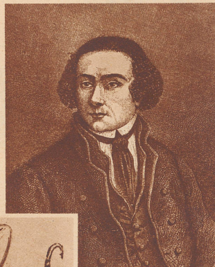
Jacques Balmat, der Eroberer des Montblanc, der für seine Tat in den Adelstand erhoben wurde.

1760 geschieht zum ersten Male etwas Entscheidendes in der Besteigungsgeschichte des Montblanc. Der junge Genfer Naturforscher und Ge-