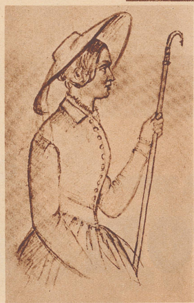
Henriette d'Angeville, genannt die «Montblanc-Braut». Sie war die «erste Dame», die den Montblanc erstieg. Auch das sind jetzt beinahe hundert Jahre her; das denkwürdige Ereignis fällt in das Jahr 1838.

lehrte Horace-Bénédict de Saussure sieht den Montblanc von Chamonix aus und beschließt, ihn zu besteigen. Er setzt Geldpreise aus für die Erkundigung eines gangbaren Weges. Während Jahren umwirbt Saussure den Berg, die Eroberung des höchsten Alpengipfels wird zum vornehmsten Ziel seines Lebens. Aber noch 1778 erklärt er es als unerreichbar. Auch die Einheimischen beginnen sich für den Berg zu interessieren, nicht zuletzt wegen des winkenden