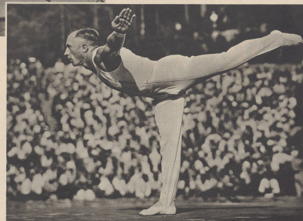
Der Deutsche Schweizermann, Gewinner der goldenen Medaille im Pferdturnen, der Deutsche Frey, machte hier 9,53, aber er hatte sich mit der Note 9,6 bei der obligatorischen Übung einen Vorsprung herausgeholt. Der Schweizer Bachmann ist der Gewinner der dritten, bronzenen Medaille an diesem Gerät.