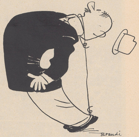
Der gespannte Zuschauer