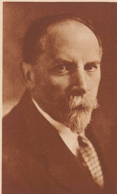
Professor Dr. med. Ad. Meyer Bürger von Zürich, feierte in Baltimore am 13. Septem- ber seinen 70. Geburts- tag. Nach Absolvierung seiner medizinischen Aus- bildung in Zürich und län- geren Studienreisen im Aus- land begann unser Lands- mann seine Karriere 1892 in den Vereinigten Staaten. Er ist seit 1910 Professor der Psychiatrischen und Direktor der Psychiatrischen Klinik an der bekannten Johns Hopkins Universität in Baltimore. Der ver- diente Gelehrte und Arzt gehört zu den anerkannt- testen Vertretern seines Faches in Nordamerika.