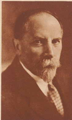
Professor Dr. med. Ad. Meyer Bürger von Zürich, feierte in Baltimore am 13. Septem- ber seinen 70. Geburts- tag. Nach Absolvierung seiner medizinischen Aus- bildung in Zürich und län- geren Studienreisen im Aus- land begann unser Lands- mann seine Karriere 1892 in den Vereinigten Staaten. Er ist seit 1910 Professor der Psychiatrischen und Direktor der Psychiatrischen Klinik an der bekannten Johns Hopkins Universität in Baltimore. Der ver- diente Gelehrte und Arzt gehört zu den anerkanntesten Vertretern seines Faches in Nordamerika.