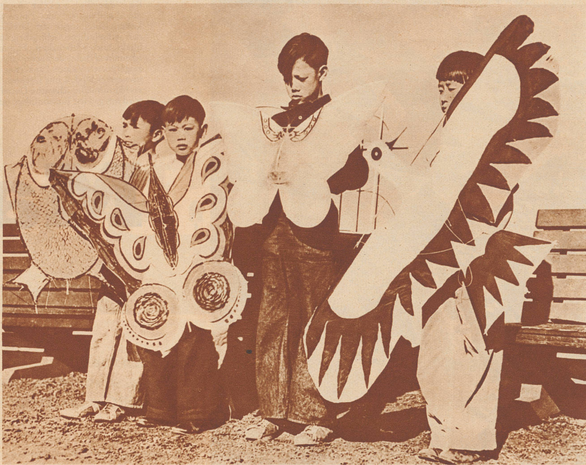
Drachenfest in San Francisco

In San Francisco fand das große Drachenfest der Chinesenkinder statt. Der Tradition ihrer Heimat gemäß bauten die kleinen Chinesen Drachen, die seltsame Vögel und Fische, Schmetterlinge und viele andere Tiere darstellten. Das Bild zeigt vier kleine Teilnehmer an dem Drachenswettbewerb, die mit ihren selbstgebauten Drachen wertvolle Preise gewannen.