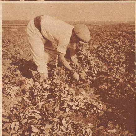
Herausgerissene Arachis- oder Erdnüsspflanze mit reifen Nüsschen.

Bei Valencia in Spanien dehnt sich ein über 200 Kilometer weites Erdnüssfeld aus. Die Erdnüss wächst an kleinen, Kartoffelsträuchern ähnlichen Stauden. Da sich die Samen mit den Pflanzenstielen in die Erde bohren, muß die Pflanze bei der Ernte der Erdnüsschen ganz ausgerissen werden.