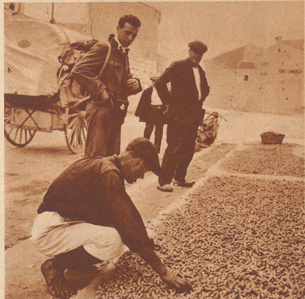
Die Erdnüsse werden auf dem Boden an der Sonne getrocknet und schließlich mit einem Rechen von allen Erdresten befreit.

Bei Valencia in Spanien dehnt sich ein über 200 Kilometer weites Erdnüssfeld aus. Die Erdnüss wächst an kleinen, Kartoffelsträuchern ähnlichen Stauden. Da sich die Samen mit den Pflanzenstielen in die Erde bohren, muß die Pflanze bei der Ernte der Erdnüsschen ganz ausgerissen werden.