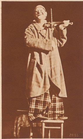
Grock im Wintergarten

Senkrecht: 1. Heber, 2. Be, 3. Emilia, 4. Lido, 5. Nein, 6. Elegie, 7. Ga, 8. Saran, 10. Linz, 11. Star, 11a) Star, 12a) Star, 14. Anemone, 16. Orestes, 19. Arena, 22. Lea, 23. Met, 25. Rege, 26. Sinter, 28. Empore, 29. Eger, 30. Samum, 31. Garn, 32. Skat, 34. Aller, 36. Dora, 38. Ader.