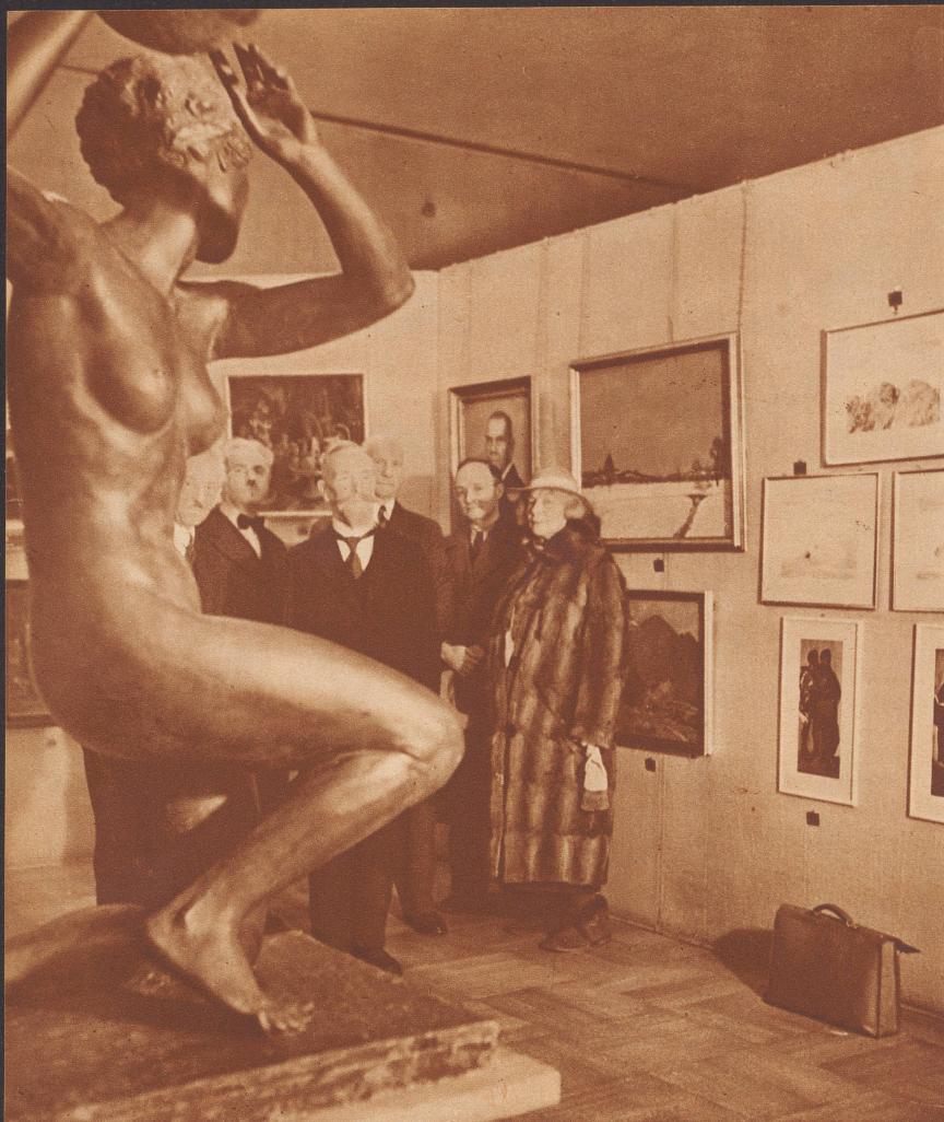
Schweizer Kunst in München

La «Zürcher Illustrierte», dorénavant ZI , est devenue bilingue. Pourquoi? diront les uns. Pourquoi pas? répondons-nous. Tranquillisez-vous, nous n'avons pas l'intention de vous accabler de longs articles ou d'augmenter encore la floraison déjà riche de vos journaux. Nous voulons aujourd'hui tendre tout simplement la main aux Romands déjà nombreux qui nous apprécient et faciliter le chemin à ceux qui désirent nous connaître en ajoutant à nos légendes et articles un court texte français. Nous sommes heureux de prouver une fois de plus que nous sommes vraiment Suisses et décidés à résoudre la question bilingue, la seule qui puisse nous séparer. Compatriotes Romands, l'Athènes de la Limmat n'est pas très éloignée de votre belle contrée. Réservez au salut hebdomadaire qu'elle vous adresse par la ZI un accueil bienveillant et compréhensif dont elle saura se montrer reconnaissante.