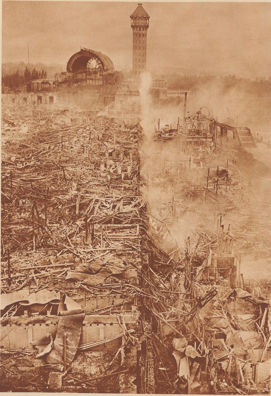
Die Ueberreste. Blick auf die Brandstätte am 1. Dezember, nach der Katastrophennacht. Die Glaswände sind geschmolzen, die Holzbestandteile sind verbrannt, das Eisenskelett ist eingestürzt, ein wirres Chaos von Eisenträgern bedeckt noch die Grundmauern. Stehen geblieben sind einige Ueberreste des Hauptschiffes und die beiden Wassertürme. Der Schaden beläuft sich auf 30 Millionen Schweizerfranken. ● L'incendie dont on apercevait les flammes à plus de 80 kilomètres fit, en une nuit, plus de 30 millions suisses de dégâts.