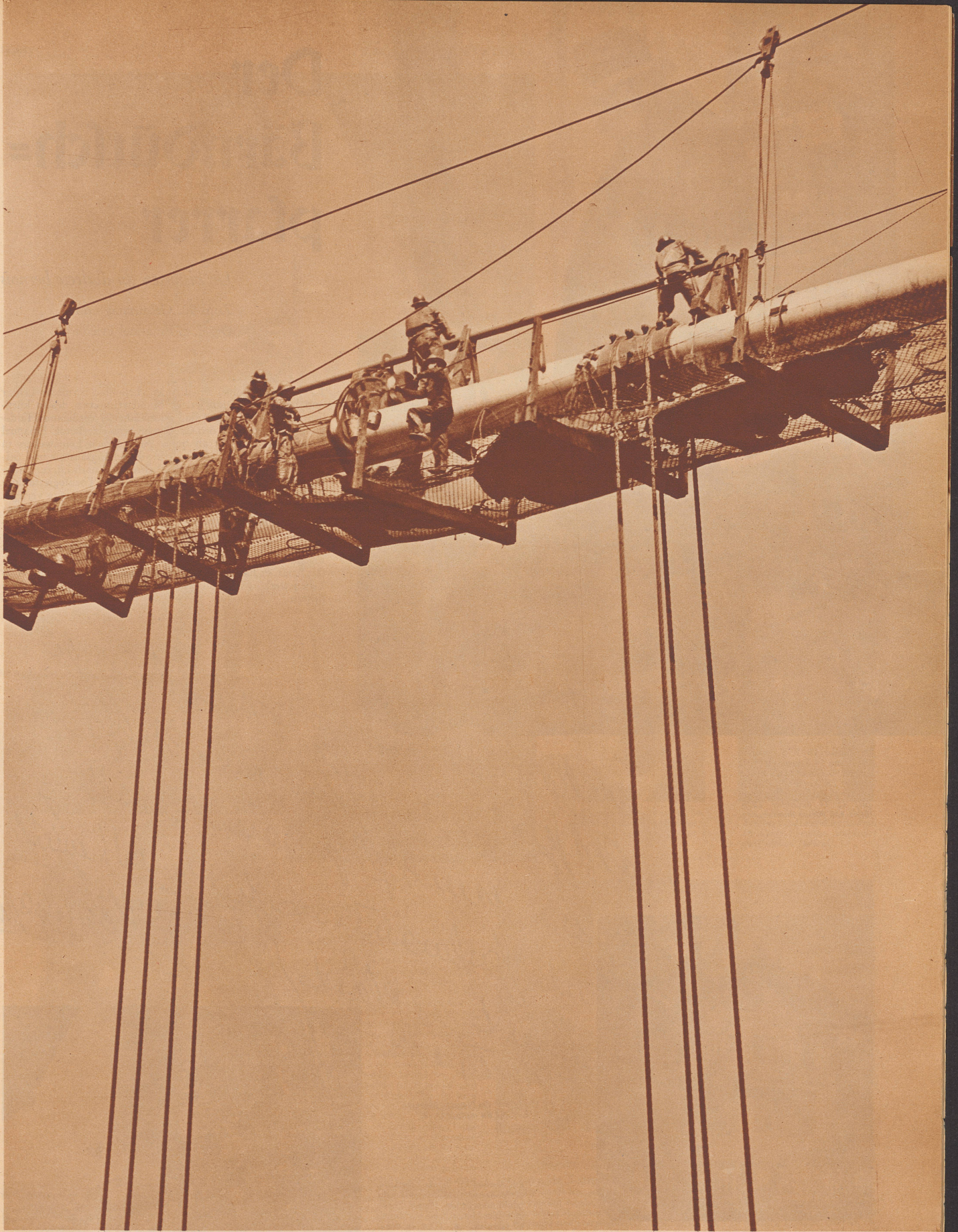
Arbeiter beim «Spinnen» der Tragkabel der San Francisco-Oakland Bay-Brücke. Les ouvriers «tressent» les câbles du pont suspendu San-Francisco-Oakland Bay.