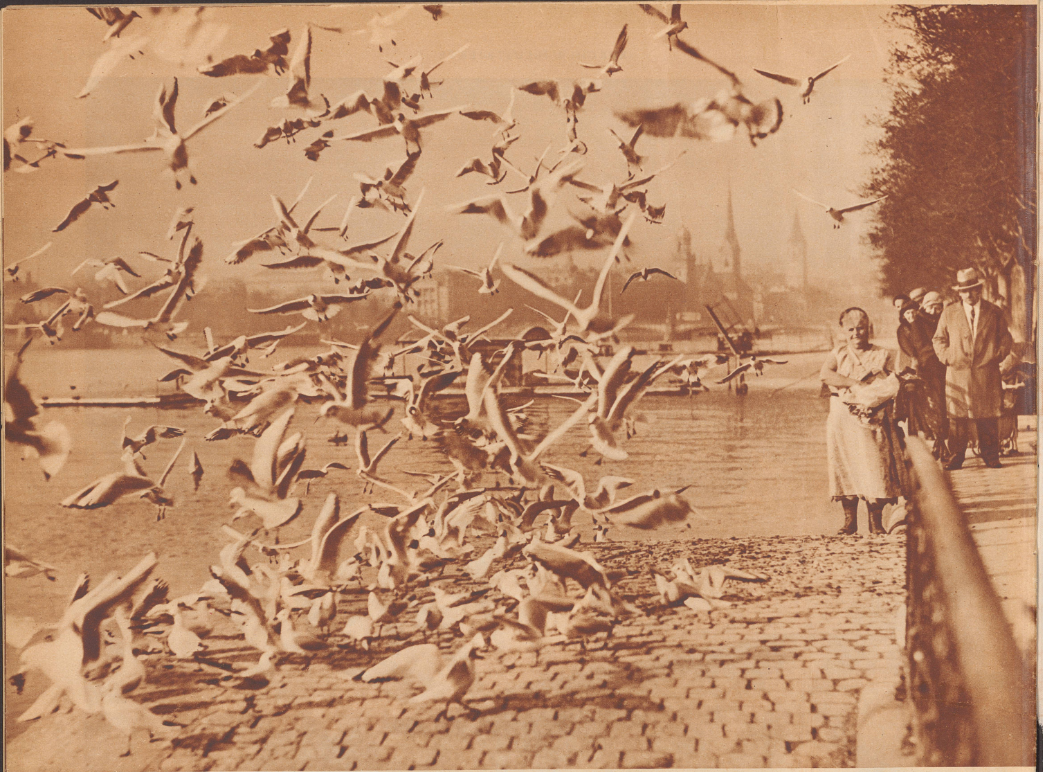
Hungrige Möven am See in Zürich. ★ «Il neige des mouettes sur le lac» ... de Zurich.