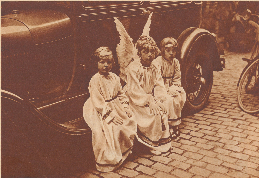
Müde Engel auf dem Trittbrett eines Autos. Aufnahme von der Heiligblut-Prozession in Brügge. Sur le marchepied d'une auto, les anges, fatigués, se reposent. Photo prise à Bruges, avant la procession du Saint-Sang.