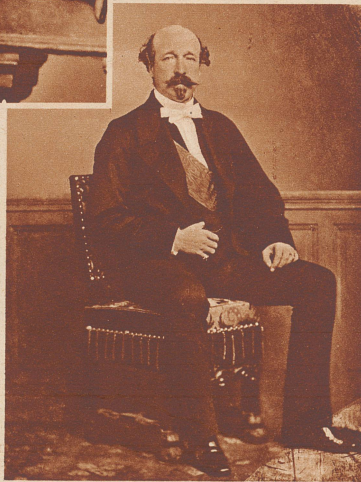
Herzog von Morny (1811—1865)

Lulu. Le fils de Napoléon III fut élevé dès son âge le plus tendre pour être soldat. Né en 1856, il mourut, engagé volontaire, en 1879, sous les sagaises des Zoulous.