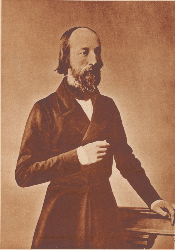
Graf von Falloux (1811—1886)

(Die zwei letzten Abschnitte wurden dem im Verlag H. R. Sauerländer & Co., Aarau, erschienenen Buche von Walther Hönerwadel «Allgemeine Geschichte 1814—1914» entnommen).