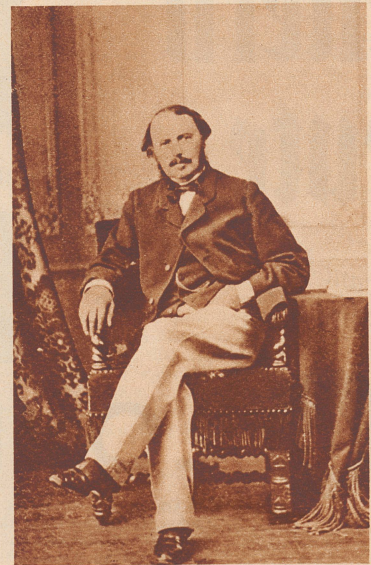
Herzog von Persigny (1808-1872)

Ueber zehntausend Verbannungsurteile vervollständigend das Ergebnis. Der Präsident, auf zehn Jahre bestellt, verfügt über alle Streitkräfte, hat das Recht, Krieg zu erklären und Frieden, Bündnisse, Staatsverträge zu schließen; er hat die Initiative zur Gesetzgebung und kann jederzeit jede