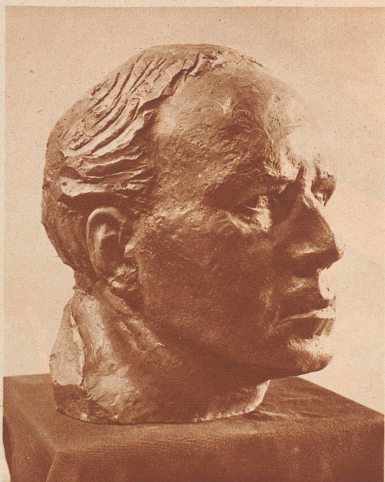
GEORG KOLBE: Selbstbildnis.

Une exposition de sculpteurs allemands au «Kunsthhaus» de Zurich.