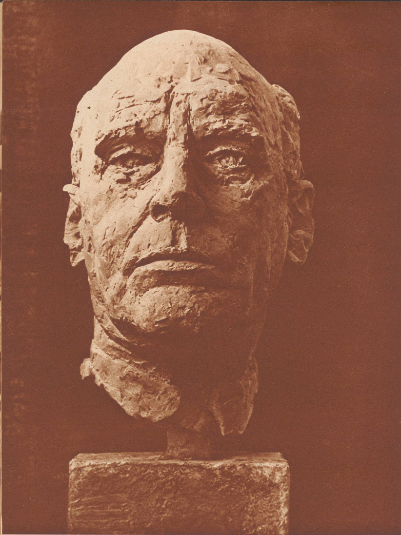
KARL ALBIKER: Bildnis des Malers Ludwig von Hofmann. Albiker, heute sechzigjährig, stammt aus Uehlingen im Schwarzwald und wirkt als Lehrer an der Kunstakademie in Dresden.

Karl Albiker: Portrait du peintre Ludwig von Hofmann, stuc.