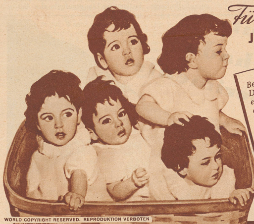
WORLD COPYRIGHT RESERVED. REPRODUKTION VERBOTEN

Wenn man es richtig erwoh — Beate schien so selbstverständlich neben und hinter all den neuen Dingen wie jetzt in ihrer schönen Harmonie. Sie hätte beinahe dabei sein können, — ja, manchmal wünschte man es viel-