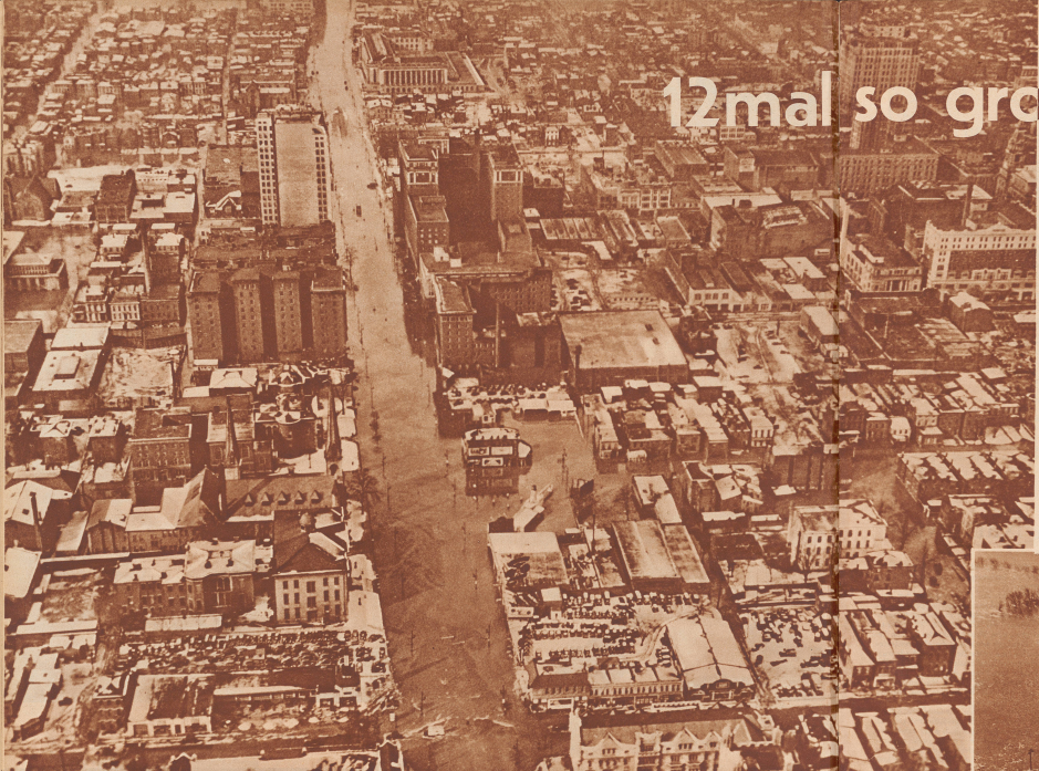
Die Stadt Louisville am Ohio im Staat Kentucky. Wohn- und Geschäftshäuser sind geortet. Gerade durch das Bild hin zieht sich die Hauptstraße. Man beachte an den Häusern, wie hoch das Wasser steht. Die Stadt ist groß, wie das erweitere Zersiedelungsgebiet, wo die Hochbauten, die vier Meile über der Stadt hinaufziehen, gerade sich an dem Wasser schmiegen.

Die Uberschwemmungs-Katastrophe in den USA.