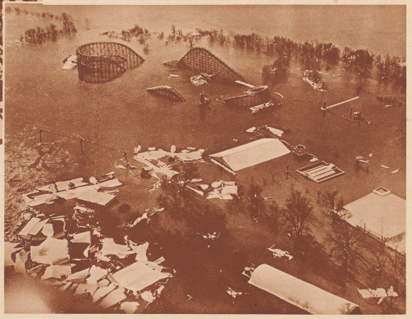
Das war der Vergessenspark in Cincinnati, der Hauptstadt des Staates Ohio am oberen Ohio, etwa 200 Kilometer oberhalb Louisville. Wie auf dieser Straße von 200 Kilometern am Fluss liegt, ist überschwemmt, ebenso die Städte, welche 1000 und 2000 Kilometer weiter abwärts am Strom liegen.