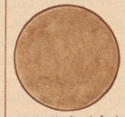
Bild 3: Kopfhautbefund des gleichen Falles nach Trilysin-Behandlung: Die Pilze sind verschwunden!

Trilysin: Flasche Fr. 4.25, Doppelflasche Fr. 6.75. Trilysin-Haaröl: Fr. 2.—. Für die schonende Haarwäsche: Trilypon, Flaschen Fr. 1.25 u. 2.75