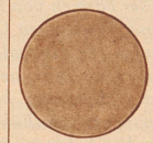
Bild 3: Kopfhautbefund des gleichen Falles nach Trilysin-Behandlung: Die Pilze sind verschwunden!

Trilysin: Flasche Fr. 4.25, Doppelflasche Fr. 6.75. Trilysin-Haaröl: Fr. 2.—. Für die schonende Haarwäsche: Trilypon, Flaschen Fr. 1.25 u. 2.75