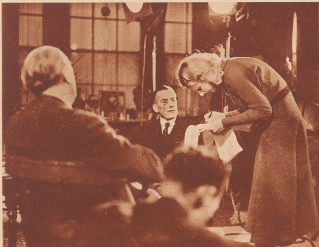
Sir Austen Chamberlain bei einer Sprechübung in der Wohnung des Schriftstellers. Très photogénique, Sir Austen Chamberlain, monocle à l'œil, répète son rôle.

Funérailles soviétiques. Staline (à droite) et derrière lui Kaganowitsch, Molotow (à gauche) et derrière lui Woroschilow transportent les cendres du commissaire du peuple à l'industrie lourde Ordschonikidse, subitement décédé.