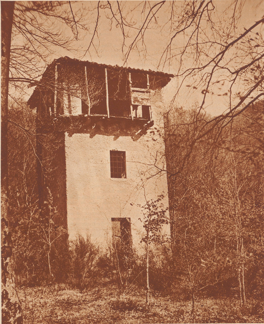
Ueber Figino steht mitten im Buchenwald ein vereinsamter Roccolo mit zerfallenen Treppen.

Erscheinen zwanglos in der «Zürcher Illustrierten» • Alle für die Redaktion bestimmten Sendungen sind zu richten an die «Geschäftsstelle des Wanderbunds», Zürich 4, am Hallwylplatz