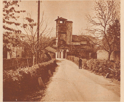
In Certenago, an der Straße von Lugano nach Agra, führt eine Haltestelle des Postautos den Namen «Roccolo».

waren sie aus blaugrauen Schnüren gestrickt, die sich vom Himmel kaum abhoben. Die Lockvögel hielt er in Käfigen, die am Torbogen und im Gezweig aufgehängt wurden, oder er band sie in der Nähe eines Käuzchens an Schnüre, so daß sie dieses umflattern und ein tolles Spiel mit ihm trieben. Wenn dann das Pfeifen und Singen, Gezwitzchen und Geflatter losging, steuerten die vom Alpenflug ermüdeten Zugvögel schwarmweise auf die verlockenden Baumgruppen zu. Im ge-