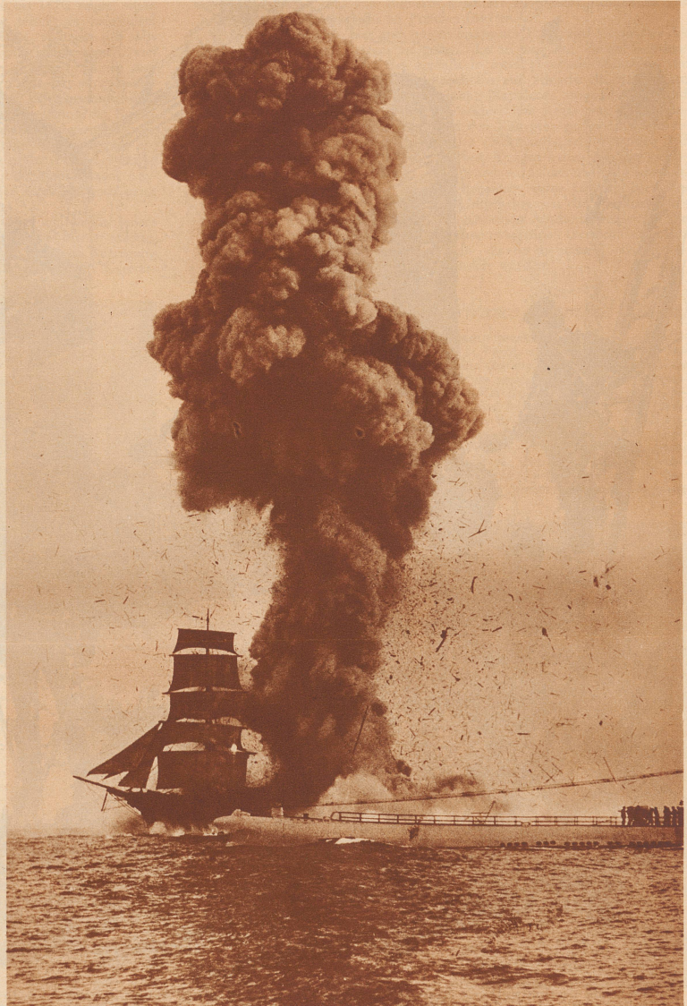
Bei den Manövern der Pazifik-Unterseebootflotte wurde ein alter ausgerangierter Dreimaster durch einen Torpedo zerstört. Das todbringende Unterseeboot ist rechts auf dem Bilde zu sehen. Eine riesige Rauchsäule entstieg dem Schiff, nachdem der Torpedo im Schiffsleib explodiert war.