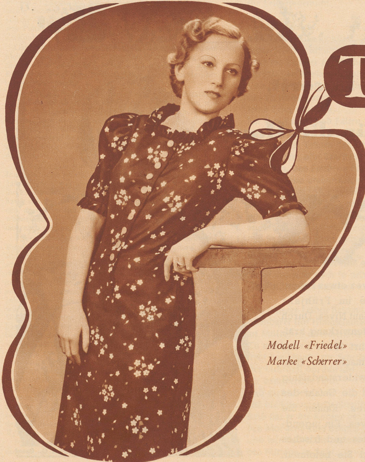
Modell «Friedel» Marke «Scherrer»

22) Der schwarze König kann nicht mehr zur Bauernlinie eindringen und Dr. Tartakower mußte nach einem zähe geführten Kampf die Waffen strecken.