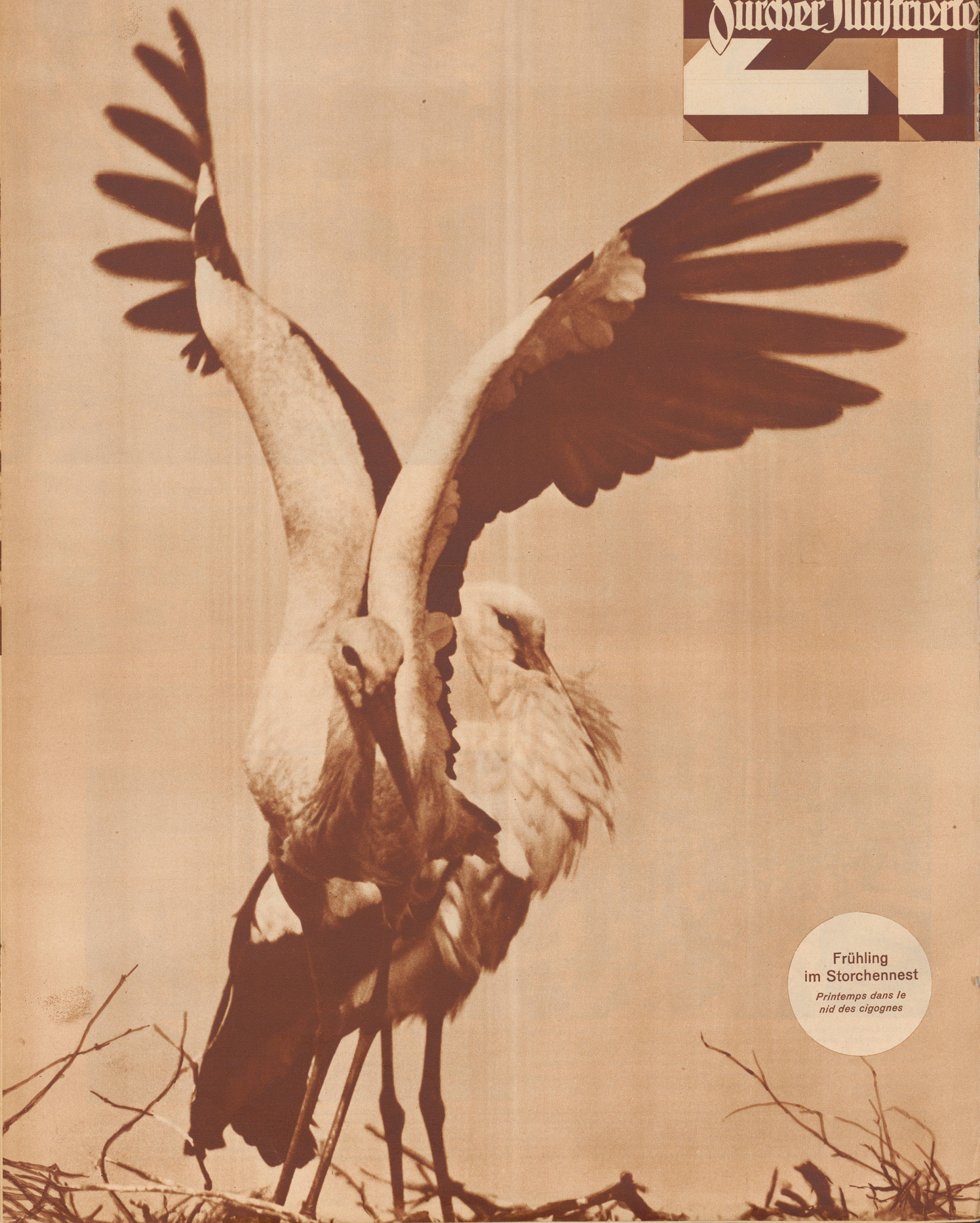
Frühling im Storchennest Printemps dans le nid des cigognes