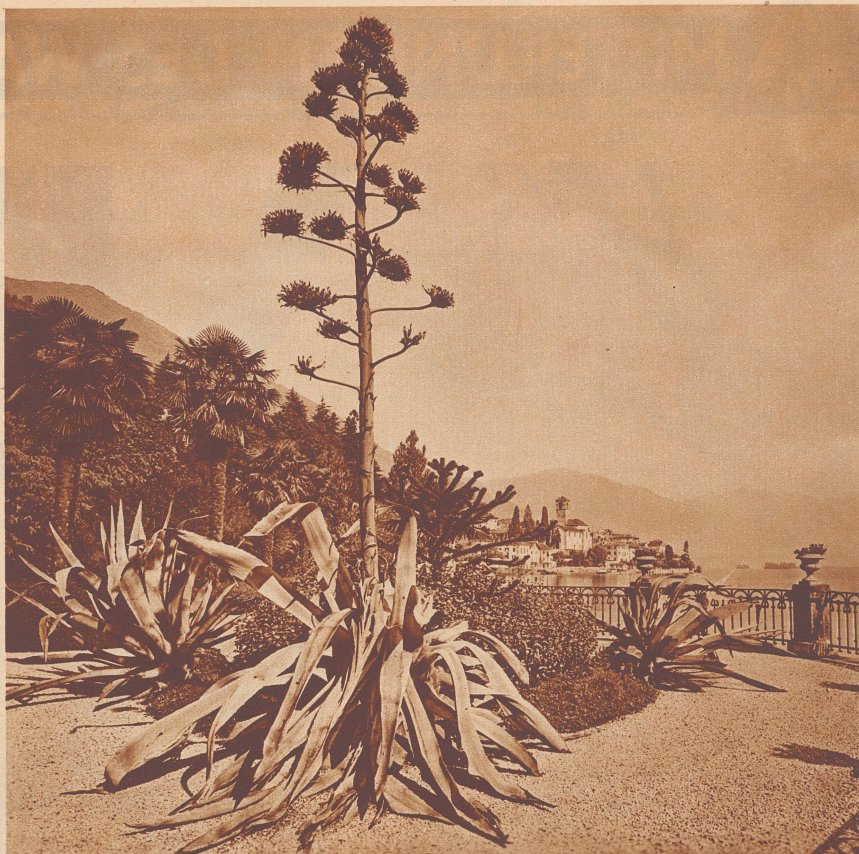
Ein Maientag an den Ufern des Langensees. Blick von Süden auf Brissago.

Das Oel aber, mit dem dies geschah, soll dem Erzbischof Thomas Becket von der heiligen Jungfrau selbst übergeben worden sein.