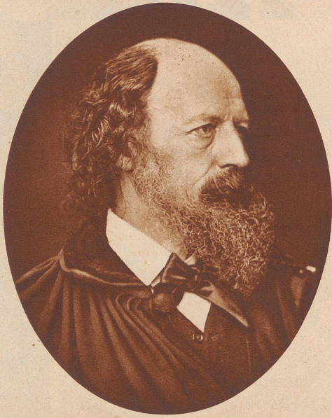
Der große englische Dichter Alfred Tennyson (1809–1892)

dessen Dichtungen den ästhetischen und moralischen Inhalt der viktorianischen Epoche zum Ausdruck bringen. Von seinen Dichtungen am bekanntesten sind die Dorfidylle «Enoch Arden», die patriotische Ode auf den Tod des Herzogs von Wellington und der «Angriff der leichten Brigade», welcher Dichtung sich jüngst sogar der Film angenommen hat.