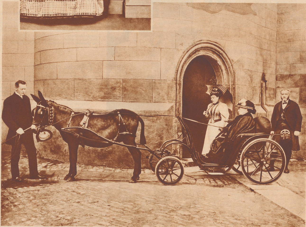
Die Königin bei der Ausfahrt

Sa Gracieuse Majesté la Reine Victoria et S. A. R. le Prince-consort Albert.