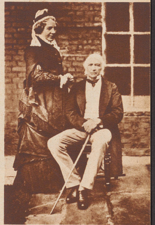
William Gladstone (1809–1898)

la Prusse et l'Autriche et sceller l'Entente cordiale avec la France et quelques années plus tard un Lord Palmerston établir la Quadruple Alliance (Russie, Autriche, Turquie 1840) et dénoncer l'Entente cordiale (1846) à la suite des mariages espagnols. Une lutte continuelle opposera en fin de siècles les conceptions du libéral Gladstone à celle du conservateur Disraëli et de l'unioniste J. Chamberlain, mais l'Impérialisme britannique, dont la dernière manifestation sera la guerre du Transvaal et l'annexion de la République d'Orange ne cessera de s'affirmer. Quelles que soient sa couleur et ses tendances, le Cabinet britannique s'immiscie dans les affaires continentales. Il a combattu la Révolution et l'Empire, aidé indirectement à la création de l'Unité italienne, tout en ménageant l'Autriche, épousé le parti du «Turc opprimé», maître