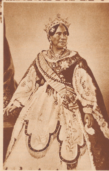
Die letzte souveräne Königin von Madagaskar aus dem Stamme der Izoas, Ranavalona II. Ranavalona II.

sdon Marko Polo bekannt, wurde später von den Portugiesen neu entdeckt. Dann machte sich zunächst der englische Einfluss breit, bis 1893 Frankreich die Insel militärisch besetzte und sich 1895 durch einen Vertrag die Schutzherrschaft sicherte. 1896 wurde aber die letzte Königin, die während des Regens der französischen Eroberungen auf den Thron gekommen war, abgesetzt und Madagaskar zur Kolonie erklärt. Gallieni ordnete seine Militär Lyautey die Zerstörung der Insel. Bild: Die feierliche Krönung der Königin Ranavalona II. in Tananarive, der Hauptstadt von Madagaskar. Couronnement de Ranavalona III, reine de Madagascar, à Tananarive.