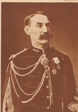
General Gallieni (1849-1916)

Paul Doumer (1857-1932), dont l'assassinat pay le russe Gorguloff est encore dans toutes les mémoires, fut de 1897 à 1902 Gouverneur général de l'Indochine.