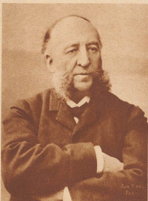
Jules Ferry (1832-1893)

Aus der Artikelreihe: «Vorgestern, Gestern, Heute»