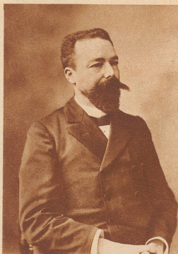
Paul Doumer (1857-1932)

Der bedeutende englische liberale Staatsmann John Bright erklärte zu Ende der Fünfzigerjahre, das werde einmal ein glücklicher Tag sein, an dem England kein Stückchen Land mehr auf dem asiatischen Kontinent besitzen werde. Bismarck, der alles, nur kein Liberaler war, sagte viel später: «Für Deutschland wären Kolonialgeschäfte gerade so, wie der seidene Zobelpelz in polnischen Adelsfamilien, die keine Hemden haben.» Und Frankreich? Auch hierüber hatte Bismarck