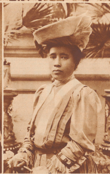
Die jüngste Königin Ranavalona III. im Exil. Les enfants rattachés au trône de Madagascar sous les reines. Ranavalona III en exil.

malen, falls die Bismarck freie Hand in der Kolonialpolitik gewähren würde. Sie mußte somit anglofranzösisch sein. Außenpolitische Spekulationen Bismarcks und innerpolitische Verlegenheiten eines heterogenen Reiches haben so zur Eröffnung der «heroischen Epochen» der französischen Kolonialpolitik geführt. Einmal begonnen, ging diese Politik ihre eigenen Wege. Männer wie Lyautey, Gallieni, Gouraud verließen den Boden politischer Spekulationen und trugen auf realistische Grundlagen das französische Kolonialreich auf. Nach dem Sturz Ferry ließ die Aggressivität der kolonialen Expansion Frankreichs wesentlich nach, und die Umrisse des kommenden großen englisch-französischen Ausgleichs wurden sichtbar. Es erwies sich, daß zwischen den Aspirationen Frankreichs und den erworbenen Rechten Großbritanniens keine vitalen Gegensätze bestanden. Der Kampf um Ägypten