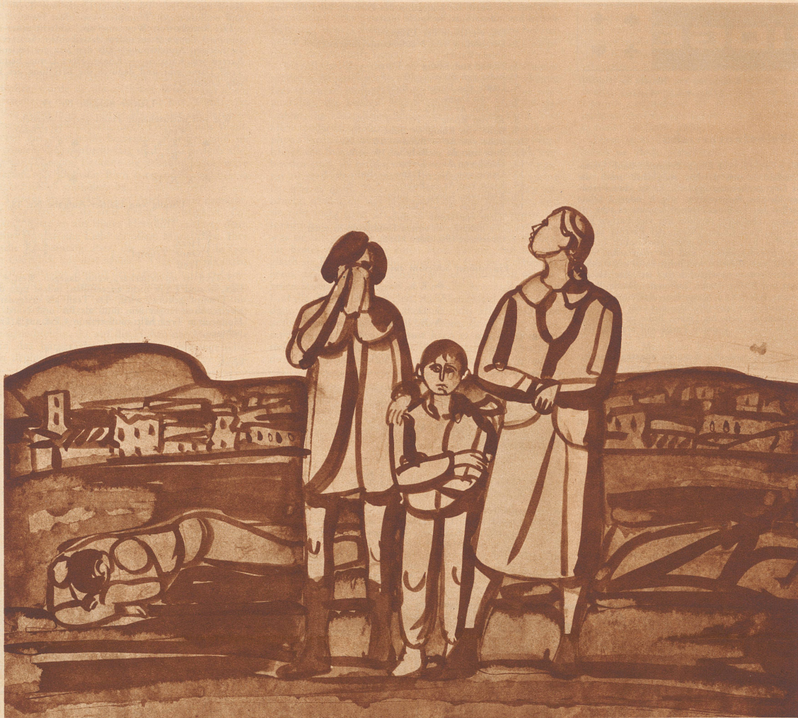
Nach dem Luftangriff

Spanische Vision — Tuschezzeichnung von Max Hunziker, zur Zeit zu sehen in der Ausstellung «Art réaliste et abstrait» in Zürich, Seefeldstraße 239 (bis 30. Juni). Diese Ausstellung geht neue Wege. Sie vereinigt Anerkanntes mit Neuem, mit Umstrittenem. Sie enthält eine Kollektion realistischer und abstrakter schweizerischer Künstler, die zeigen soll, daß die verschiedenen künstlerischen Grundsätze zusammen erst das Gesicht der Zeit geben. Das Ganze trägt nicht den Stempel einer Ausstellung im üblichen Sinn, das Museumhafte ist vermieden, die Bilder und Plastiken sind in den Räumen eines Privathauses so untergebracht, daß wir uns unter ihnen nicht als flüchtige Besucher, sondern als Gäste fühlen sollen, die Zeit haben, Zeit zum Schauen und Überlegen, wie wir selber in unsern Räumen daheim Bildern Platz geben könnten.