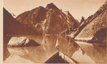
Arven des Grimselsee, deren Einsegelboot unter Norwegeren gastlich ist. La Norvège et ses fjords! Vous n'y êtes pas: le lac du Grimsel.