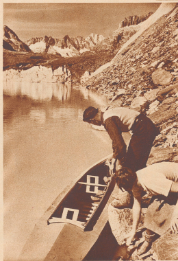
Au lieu d'un bras de la Lusterarvåte, Abstieg de canal contre le perrier.

Die Reise aus den milden Tiefen des sommerlichen Mittellandes hinauf zu den Gipfeln der Berge gleicht einer abgekürzten und zusammengefügten Reise aus unseren gemäßigten Zonen hinauf in die Polarwelt. Die Täler im Gorchalkgebiet im besonderen mit ihrem granitigen Unterbau liegen dann zwischen der milden Heimat und dem eisigen Ziel, wie Schweden und Norwegen auf dem Wege zum Pol. — Lange schon hatten wir am untern Aletschgletscher den Märgelen-See, drauf im Sommer die blinkenden Eisklötze schwimmen, als hätten sie sich von den Gletschern Spitzbergs oder Grönländs gelöst und trieben im Eismeer. Aber jetzt hat der