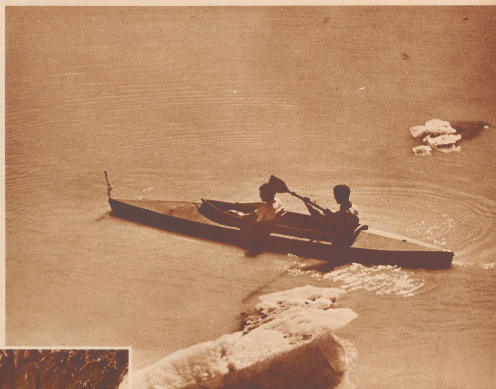
Zwischen Eisbergen auf dem Grimselsee.

hatten, bis zu 5/10 Quadratmeter Segel setzen, gegen plötzliche Böen aber durch famose Kenterschläuche geschützt. Wie ein Fjord liegt der Grimselsee ganz fünf Kilometer lang zwischen der Palstrabe, dem neuen gautischen Hügel am Nollen und dem Unterarletschler, der in den See seine Eis- und Wassermassen entsendet. Erinnert der vordere Seeriem mehr an ein norwegisches Landschaftsbild, so ist uns das westliche Seebecken von Grönländfahrten her vertraut: der Gletscher bricht steil ins Wasser ab. Zeitweise lösen sich unter mächtigem Gedröhn Teile der Eiswand, die grün-schilbernd und zerklüftet über dem Wasserspiegel steht. Eisberge schwimmen im See.