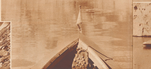
Spitzbergem oder Oberhäli! — Spitzberg? Non! Oberhäli.

neue Grimselsee aus erst recht das Schauspiel eines kahlenden Gletschers verschafft. Und als vollends ein phantasievoller Fahrer und Sportler ein Fackelboot auf dieses neue Wasser setzte, da war es ein leichtes, bei uns diese Grönländ-Bilder zu machen. Hören wir ihn: «Der freundliche Posthøker von Meringen war zuerst ein wenig erstaunt, als ich mit meinem nicht alltäglichen Gepäck anrollte: mit dem zierigen und verpackten Boot auf Rädern. Liebenswürdig half er beim Verladen im Postwagen. Mit fröhlichem Klang des Posthörns ging's zu Berg, durch die kühlen Schluchten und die weltliche Landschaft des Oberhäli. Auf der Grimsel war der Transport der Stabtauchen zum See hinunter kein reines Vergnügen. Schließlich kam aber alles wohlbehalten drunter an, das Boot war bald aufgebaut und das Absteigen konnte beginnen. Der Grimselsee eignet sich ganz vorzüglich zum Segeln, wenn man über ein genügend breites und stabiles Boot verfügt. Wir konnten, nachdem wir uns einmal mit den unterschiedlichen Winden, die hier wehen, vertraut gemacht