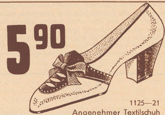
1125-21 Angenehmer Textilschuh mit blauem oder braunem Sämisch-Besatz.

Der Verkauf der Lose ist nur in und nach den Kantonen Graubünden, Freiburg, Nidwalden, Obwalden, Schwyz, Solothurn, Uri und Valais gestattet.