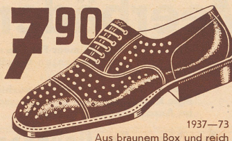
1937-73 Aus braunem Box und reich perforiert. Leicht und luftig.

Strand, weiße und farbige Damensöckchen... -70 Star, leichte Herrensöckchen aus feiner Baumwolle... -90