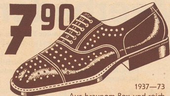
1937-73 Aus braunem Box und reich perforiert. Leicht und luftig.

Strand, weiße und farbige Damensöckchen... -70 Star, leichte Herrensocken aus feiner Baumwolle... -90