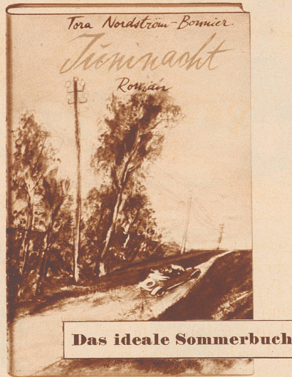
Das ideale Sommerbuch

Menschen der nordischen Großstadt, lebenswahre, heißblütige Geschöpfe mit ihren innern und äußern Konflikten, werden hier packend und offen geschildert. Ein mitreißendes Buch, das mehr bietet, als nur Unterhaltung.