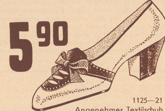
1125-21 Angenehmer Textilschuh mit blauem oder braunem Sämisch-Besatz.