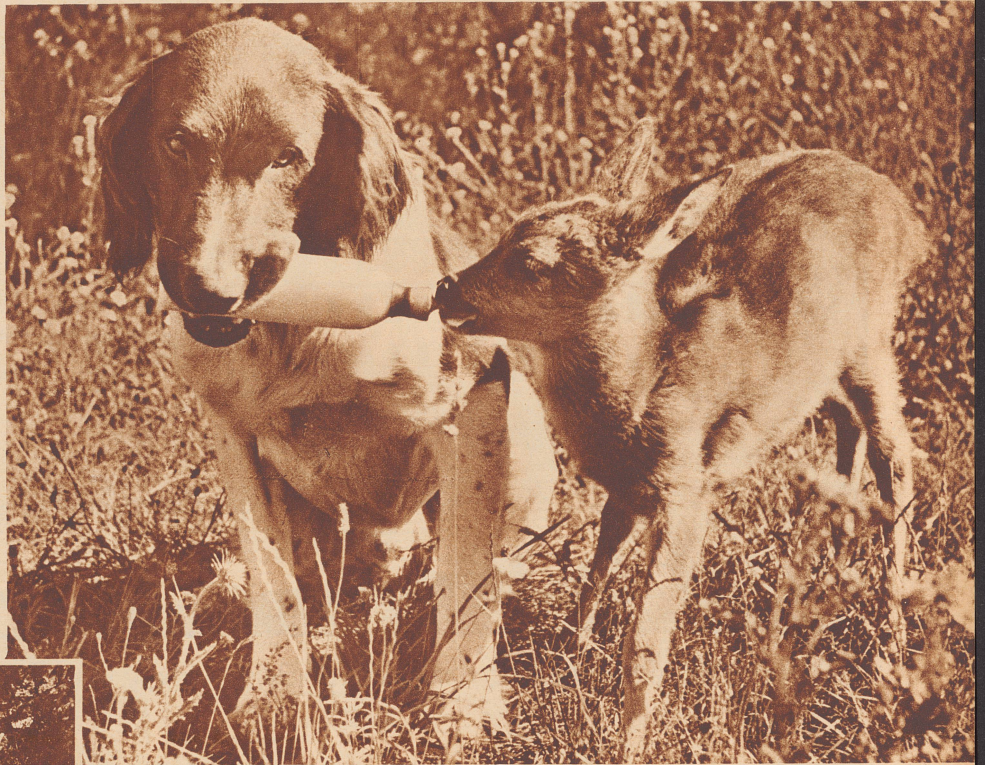
Diana reicht dem Rehkälbchen die Milchflasche. Wenn sie dem Jungen zu hoch ist, senkt der Hund den Kopf, um es dem Säugling bequemer zu machen.