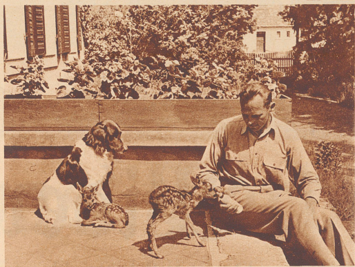
Mensch und Tier sind friedlich beisammen, wie im Märchen. Das eine Rehkälbchen liegt bei Diana, dem Jägerhund, als ob der seine Mutter wäre. Das zweite Rehjunge bekommt vom Herrn die Flasche. Diana schaut aufmerksam zu, sie will den Rehen bald selber die Flasche geben.