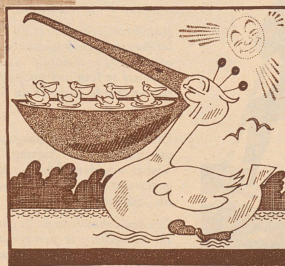
Wie sich der kleine Maxli die erste Schwimmstunde der jungen Pelikane vorstellt.