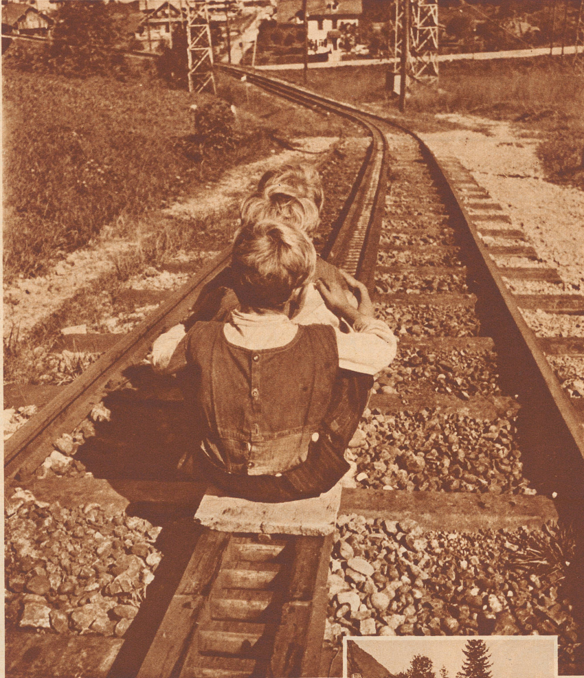
Fest aneinandergeschmiegt sausen die drei Knirpse auf ihrer «Rigibahn» zu Tal.