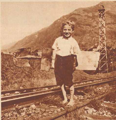
Der Konstrukteur trägt die Bahn - Schaufel und aufgenagelte Bretter - bergwärts. Die Buben hüten sich wohlweislich, ihr Patent anzumelden.