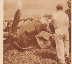
Udet und Milch, im internationalen Abprobieren für Militärflugzeuge, der am Montag geflogen wurde, wurde Generalmajor Udet mit einem Messer-Maschine 190 P. in Schwaben bei 17000 hoch. Er saß dabei mit großer Geschwindigkeit in die Strömung der Bergler-Ten-Ber-Straße und ist über die Maschine wurde weg beschädigt. Udet blieb bei. Bild: Udet neben seiner zerlegten Maschine. Die Linie quer durch das Bild ist der abgerissene Leitungsdraht, der sich im Propeller verwickelt hatte. Avant cours de la compétition internationale de circuits des Alpes pour avions militaires, qui se couvrait lundi, le Général-Major Udet et son commandant d'atterrir au Schwabli près de Thun. Lancé à grande vitesse, son appareil, un Messerschmitt 190 H.P., accrocha le fil conducteur de la ligne ferroviaire Bergler-Thun. On voit ici, l'aviateur allemand — qui s'en tira sans aucun mal — devant les débris de son appareil. Le câble qui coupe l'image est celui que brava l'engin et dont l'extrémité dans l'éclair.