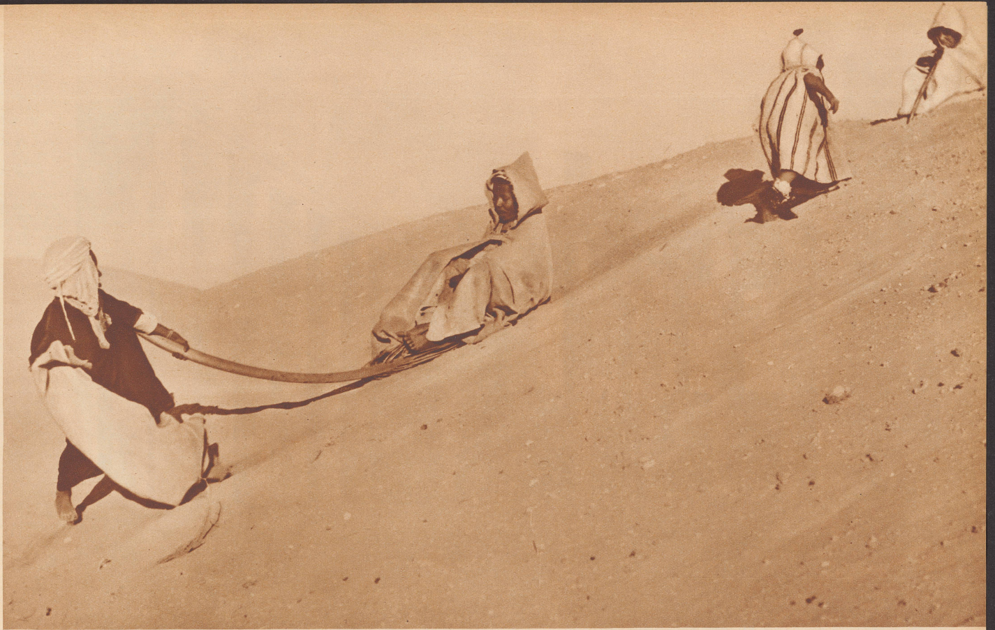
Die kleinen Berber haben ihre Freude an den Sanddünen rings um ihre Oase. Jahraus, jahrein können sie darauf schlitteln. Ihren Eltern gefallen die Sandhügel ganz und gar nicht. Sie bedrohen nur ihre Gärten und Häuser, wenn der Samum weht.