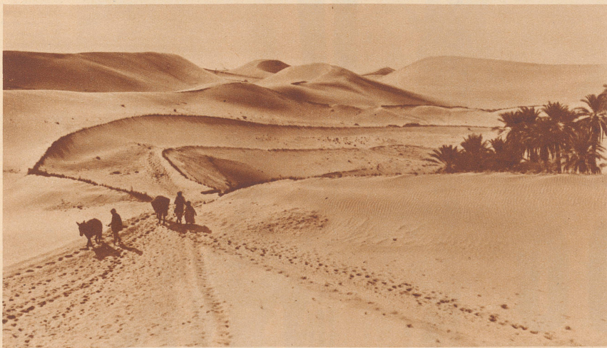
Mitten in der Wüste Sahara liegt eine Oase. Sie ist bedroht vom Sandmeer, das ständig in Bewegung ist. Es gibt Sanddünen, die im Tag mehr als einen Meter wandern. Um die Oase vor dem Versanden zu schützen, wird rund um sie herum ein fünfacher Ring von anspruchslosen Wüstensträuchern angepflanzt.

Meinung, im heißen Afrika müsse man doch überhaupt auf diese Vergnügen verzichten. Nun kommt einer, der hat es mit eigenen Augen gesehen und sogar photographiert, wie kleine Berberkinder, die auf einer Oase mitten in der Wüste Sahara wohnen, im Sommer vergnügt die Sanddünen hinunterschlitteln. Allerdings nicht wie bei uns auf richtigen Schlitten, sondern auf Palmblättern, und