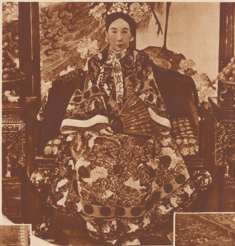
Die letzte Kaiserin Chinas, Tschü, eigentlich Jeholtschi (1834—1908), aus vorwiegend mandschurischer Familie. 1852 wurde sie Nibelantse, 1853 Frau des Kaisers Hienfong. Nach dessen Tode wurde sie Kaiserin (1861—1875), ebenso nach dem Tode seines Nachfolgers (1875—1899) und zum drittmal nach Kaisers Kaiserin mitgetragenen Staatssturz von 1898. Da sie auch zu Lebzeiten des Kaisers das eigentliche Regierung führte, herrschte sie fast ein halbes Jahrhundert lang über China. Ihr Machtbesitz führte sie zu einem unerbittlichen Despotismus, den sie allerdings durch eine diplomatische Klugheit auszugleichen versuchte. Auch durch eine Reihe von Liebesgeschichten machte sie, hierin ähnlich Katharina II. von Rußland, viel von sich sprechen.