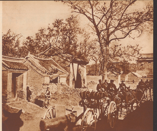
Französische Artillerie führt durch ein chinesisches Dorf. Batteries d'artillerie française traversant un village chinois.

La Chine, qu'on croit alors: Son régime n'a pas beaucoup changé depuis Confucius. L'empereur et 5000 familles de dignitaires laissent un militaire régner sur le territoire, plus grand que l'Europe et qui compte 300 millions d'habitants, 200 millions d'êtres qui s'ont de commun que la couleur de leur peau et leurs yeux noirs, qui ne pratiquent ni les mêmes langues ni les mêmes religions. La Chine a décliné la guerre à l'Angleterre.