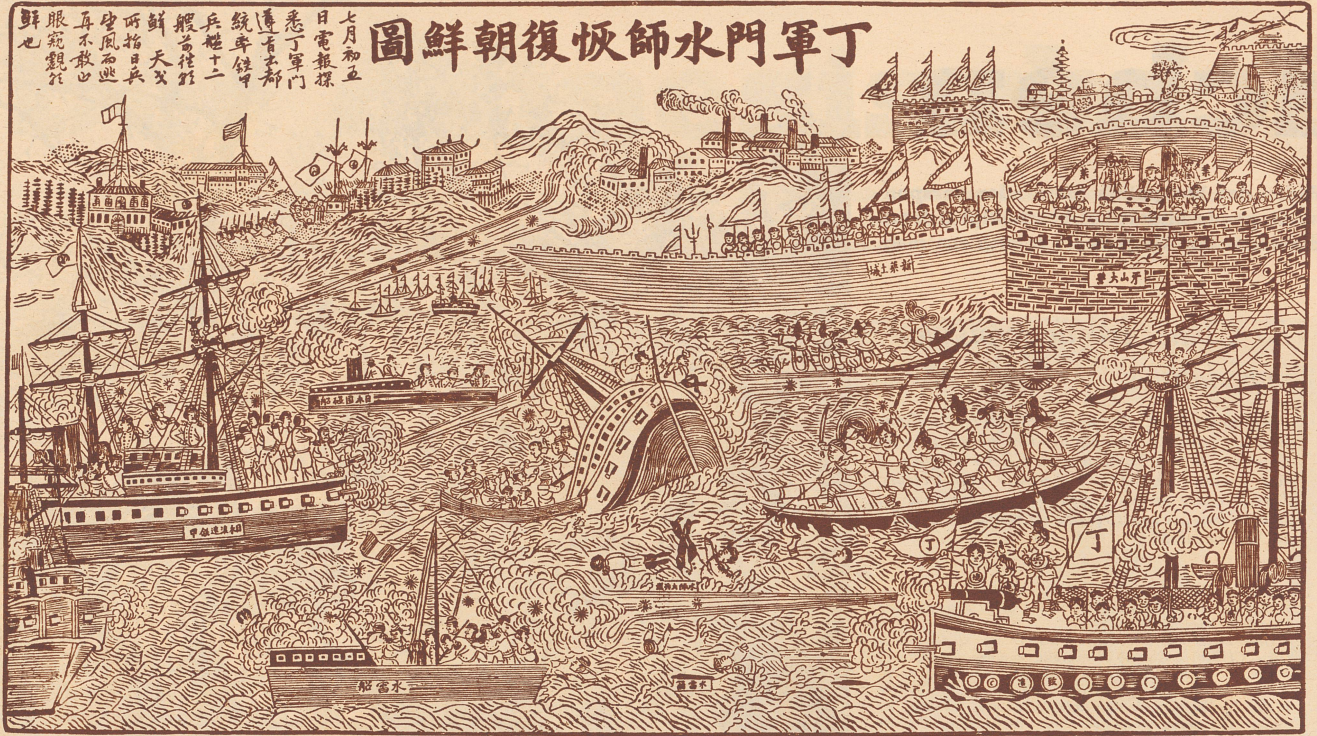
Eine chinesische Zeichnung, die eine japanisch-chinesische Seeschlacht aus dem Krieg 1894/95 darstellt. Das Bild zeigt die Chinesen als Sieger, stellt also die Tatsache auf den Kopf, da ja in Wirklichkeit die Japaner den Sieg davontrugen.