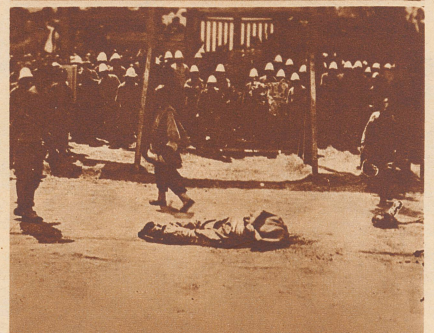
Hinrichtung eines «Boxers». Chinesen verrichten das grausame Geschäft an ihrem Landsmann vor den Augen europäischer Truppen.