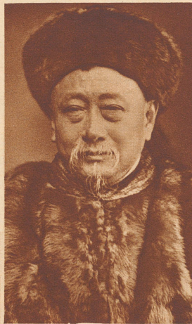
Kuo Sung-Tao, der erste Botschafter Chinas an einem christlichen Hofe. Er wurde 1875 als Botschafter nach London entsandt. Vorher hatte sich China geweigert, bleibende Gesandtschaften an den europäischen Höfen einzurichten.