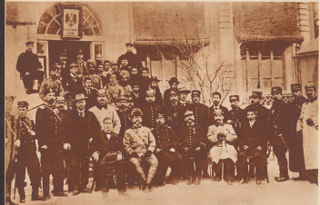
Eine internationale Kommission vor dem kaiserlich-deutschen Postamt in Tientsin am 22. Juni des Boerenskriegs. All hier vertreten: Deutschland, Frankreich, England, Rußland, Japan.