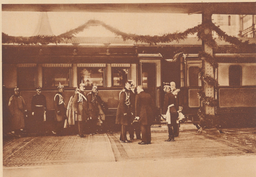
Die Ankunft des deutschen Kaisers im Hauptbahnhof Zürich, Dienstag, den 3. September um 17 Uhr 10. Großherzogener von der Höhe des Polytechnikums verkehrt die Einfahrt des kaiserlichen Hofzuges, der aus acht Wagen besteht, im Hauptbahnhof. Die an der Südrampe aufgestellte Stadtkassa Zürich trägt die Aufschrift: B.M. Die offizielle Begrüßung auf dem Bahnhof. Der Kaiser im Gespräch mit Bundesrat Motta, hinter beiden Bundespräsident Forrer; rechts von ihnen Bundesrat Hoffmann, als Chef des eidgenössischen Militärkommissars trägt er die Uniform eines Korpskommandanten; hinter ihm der deutsche Gesandte in Bern, von Romberg.

La démocratie au garde-à-vous. 21 commémore le 35 e anniversaire de la visite de Guillaume II à Zurich et livre sans commentaires superflus ces photographies à votre méditation.