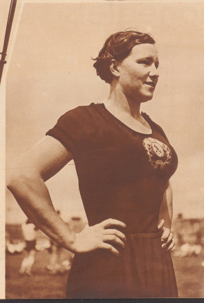
Links: Eine von den sechs russischen Kunstturnerinnen, die bei der Antwerpener Olympiade mit ihren schwebenden aber vollendeten angeführten Uebungen im Reck und Barren glänzten. L'une des six gymnastes féminines russes qui présentèrent à dresse un fort bon programme au rebond et aux barres.