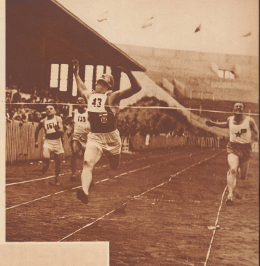
Der spannende Endspurt im 100 Meter Lauf, den der Finne Hansen in der Zeit von 15,9 Sekunden gewann. La finale du 100 mètres que remporta le Finnois Hansen en 15,9 secondes.