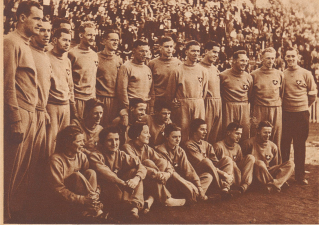
Die Schweizer Team-Delegation. — La délégation suisse.