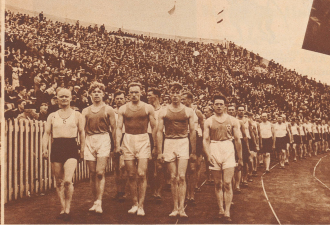
Einmarsch der ausländischen Schwimmer ins Stadion von Antwerpen, an deren Spitze indische Turner. Von zwanzig Ländern waren rund 25000 Sportler zur III. Arbeiter-Olympiade nach Antwerpen gekommen. Entrée des délégations dans le stade d'Anvers. 25000 sportifs représentant 20 pays participent au spectacle de la IIIe Olympiade ouvrière.