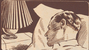
fast über Nacht.