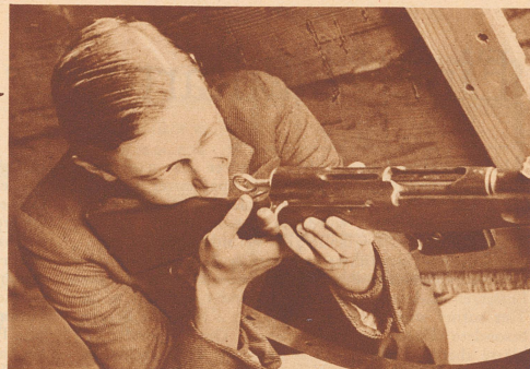
Der Schützenkönig im Anstand.