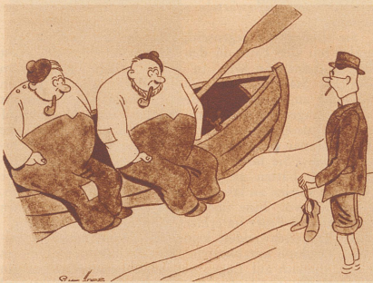
«Werden hier auch Wracks angespült?» «Nein, Sie sind das erste!» — Est-ce que la mer rejette souvent des épaves? — Non, vous êtes la première!

Priem kam vom Büro. Unterwegs riß ihm ein Windstoß den Hut vom Kopfe. «He, Sie», schreit ein Vorübergehender, «nageln Sie ihn doch auf Ihrem Kopf fest!» «Recht gern», erwidert Priem, «wenn mein Kopf aus dem gleichen Material wäre wie Ihrer!»