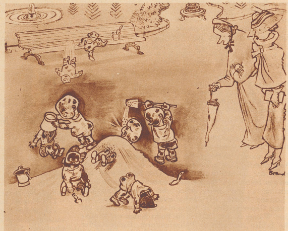
«Es ist schlimm, wie schmutzig sich die Kinder machen, gestern mußte ich ein ganzes Dutzend von den Bengeln waschen, um endlich den meinen herauszufinden.» — Ces enfants sont par trop dégoûtants. Figurez-vous qu'hier j'ai dû en nettoyer une bonne douzaine avant de retrouver le mien.

— Acheter une voiture? Pourquoi faire, tous mes amis en ont. — Hélas! cher monsieur, mon cœur est incapable de battre à moins de 500 000 francs... — C'est pour la même raison que je ne me marie pas, tous mes amis ont des femmes.