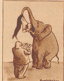
Der Elefantenzahnarzt. Le dentiste des éléphants.