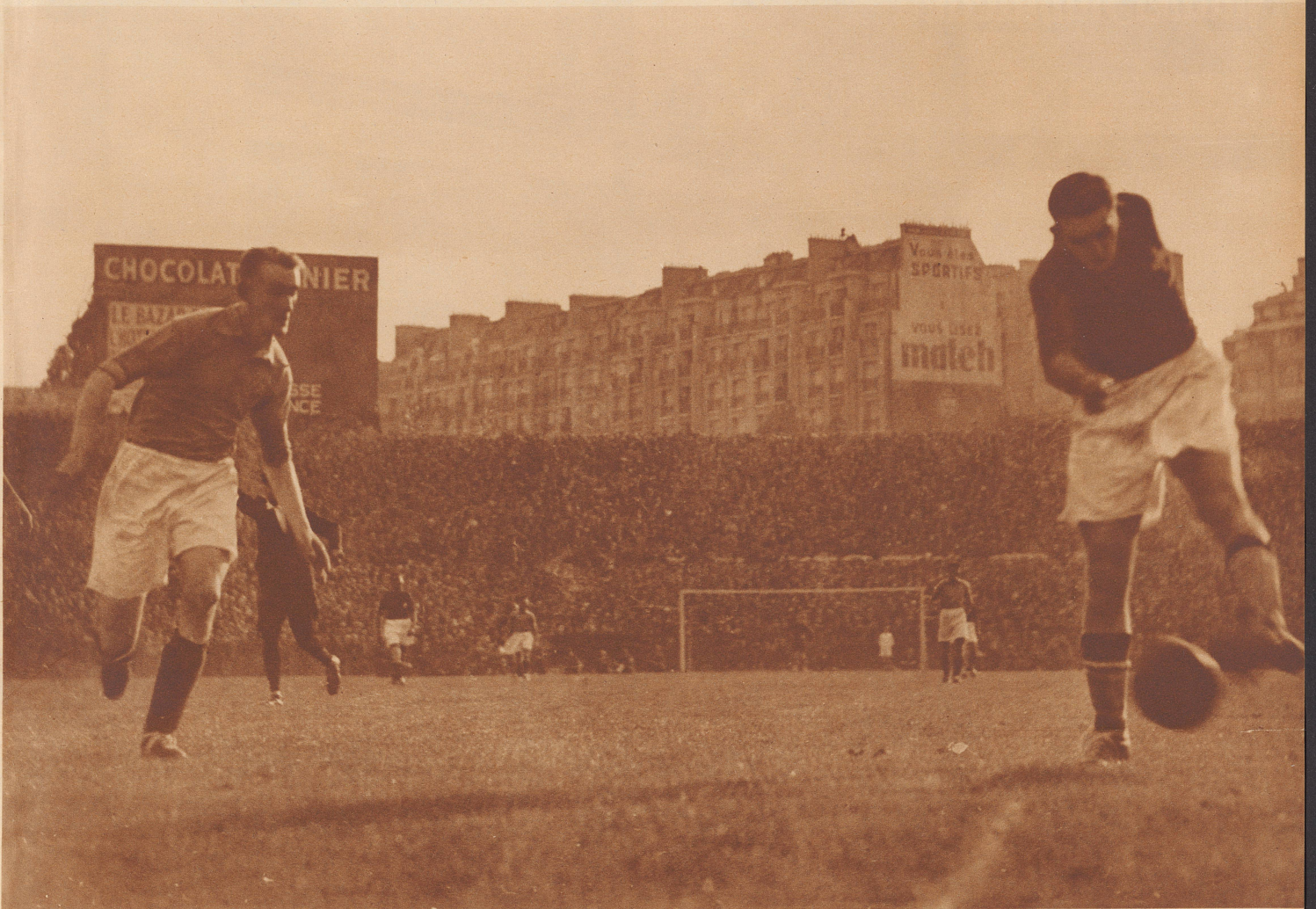
Fünzigtausend Zuschauer im Parc des Princes. Eine graue Masse, sitzen sie da, kaum zu unterscheiden von den Felswänden des riesigen Häuserblocks im Hintergrund. Dazu die riesigen Plakatschriften, die Arena im Vordergrund: Sport unserer Zeit. Match France-Suisse, au Parc des Princes, à Paris: 2:1. 50 000 personnes assistèrent à cette compétition. Notre photo donne une idée de l'énorme affluence.