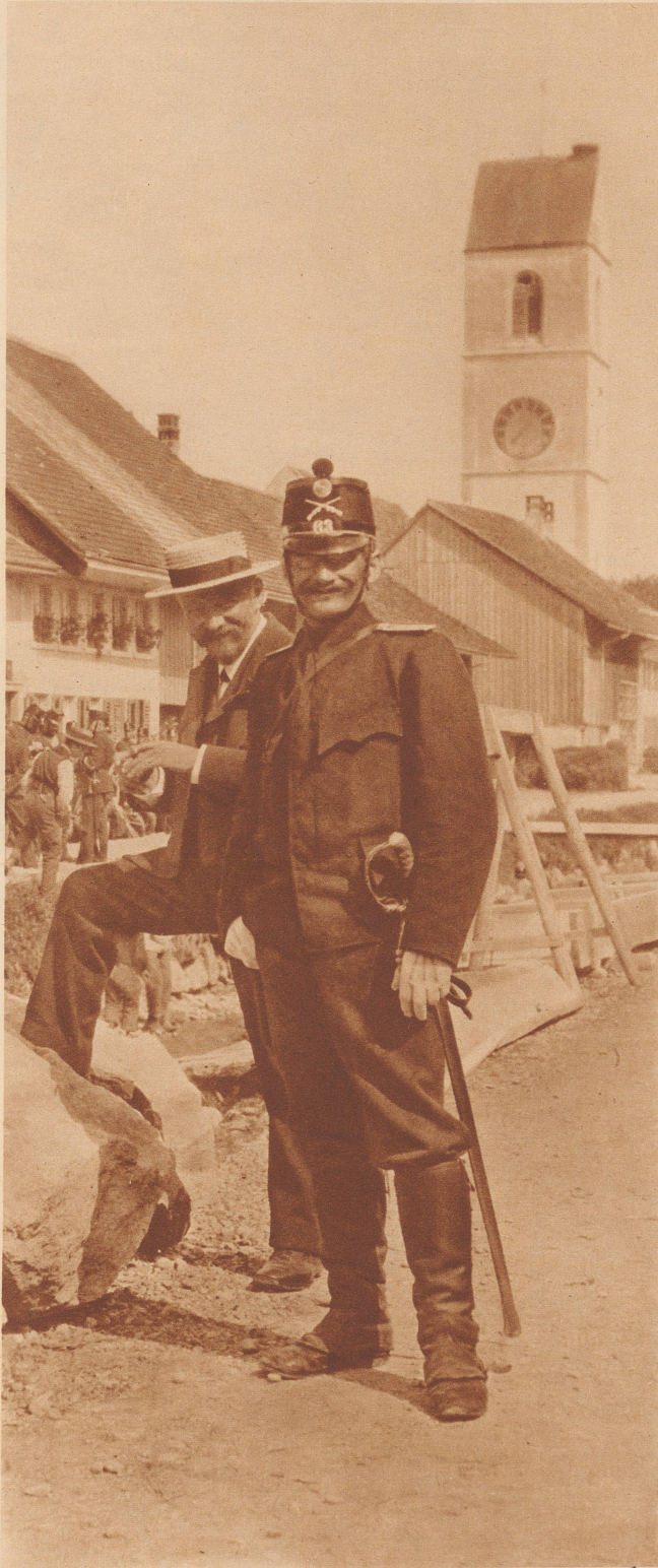
Ständerat Dr. h. c. Emil Klöti

Stadtpräsident von Zürich. Bild: Dr. Klöti als Leutnant im Bataillon 63 bei einem Wiederholungskurs in Wiesendangen im Herbst 1902.