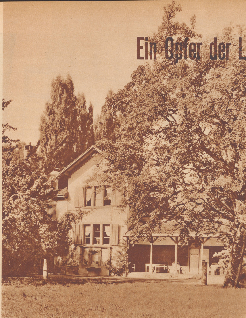
Das Kollergut, wie es heute aussieht. An das Wohnhaus schliessen sich rechts das ehemalige Atelier und die Stallungen an. La propriété Koller dans son état actuel. Cette maison sera démolie pour les besoins de l'Exposition nationale, Zurich 1939.