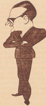
Dr. A. Aljechin «Aus Sachovy tyden»

Nach g5×h6 gewinnt Schwarz die Dame mit Dh5—f5+, Ke1 oder e3, Tg1+ oder Te4+ (Dh3—f3, Tg4—f4!) Im anderen Falle geht weiteres Material verloren.